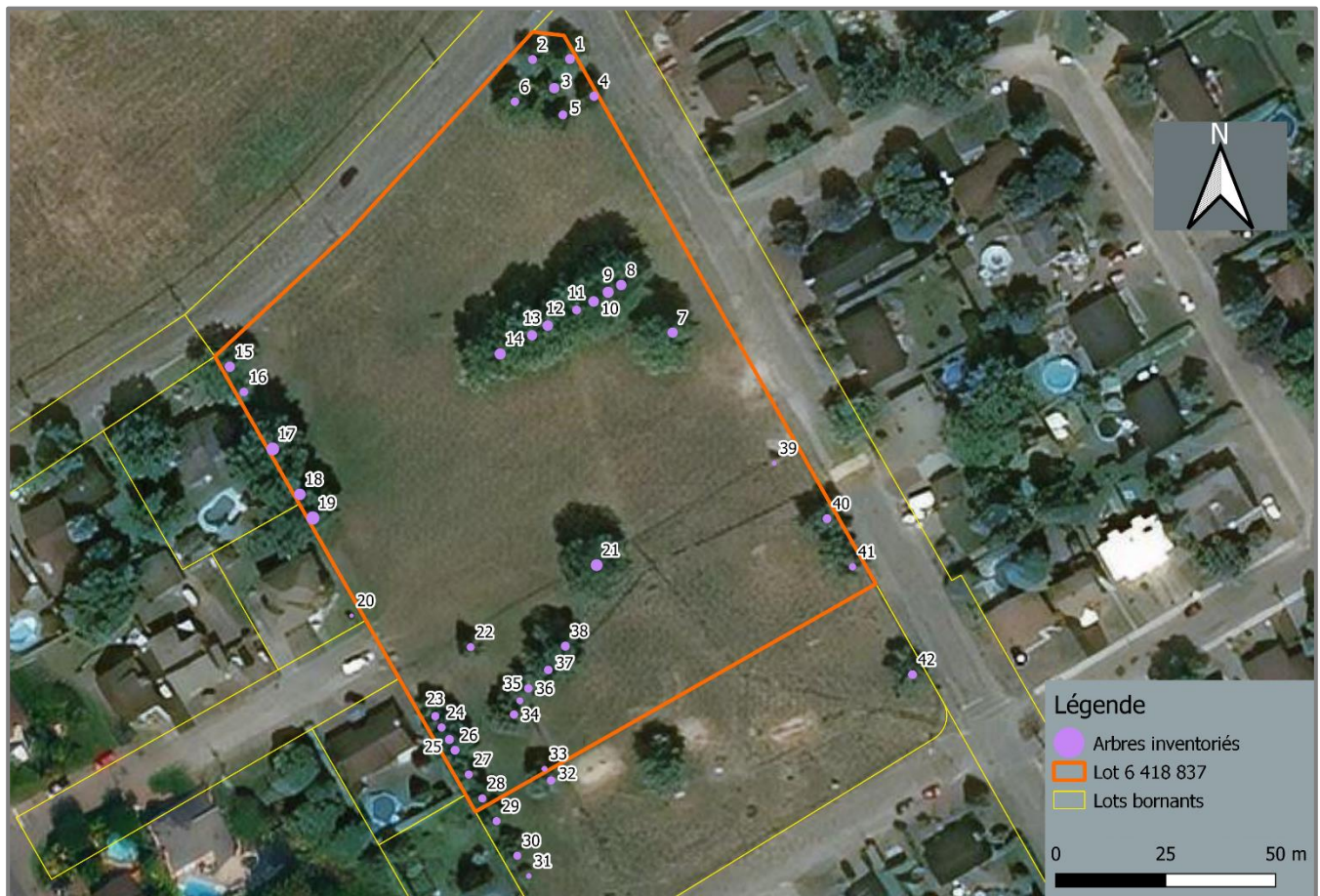
FIGURE 2 CARTE GÉNÉRALE DU LOT ET DES ARBRES INVENTORIÉS

Les arbres évalués sont situés dans le Parc des Mouettes à Sallaberry de Valleyfield, identifié par le numéro de lot 6 418 837.