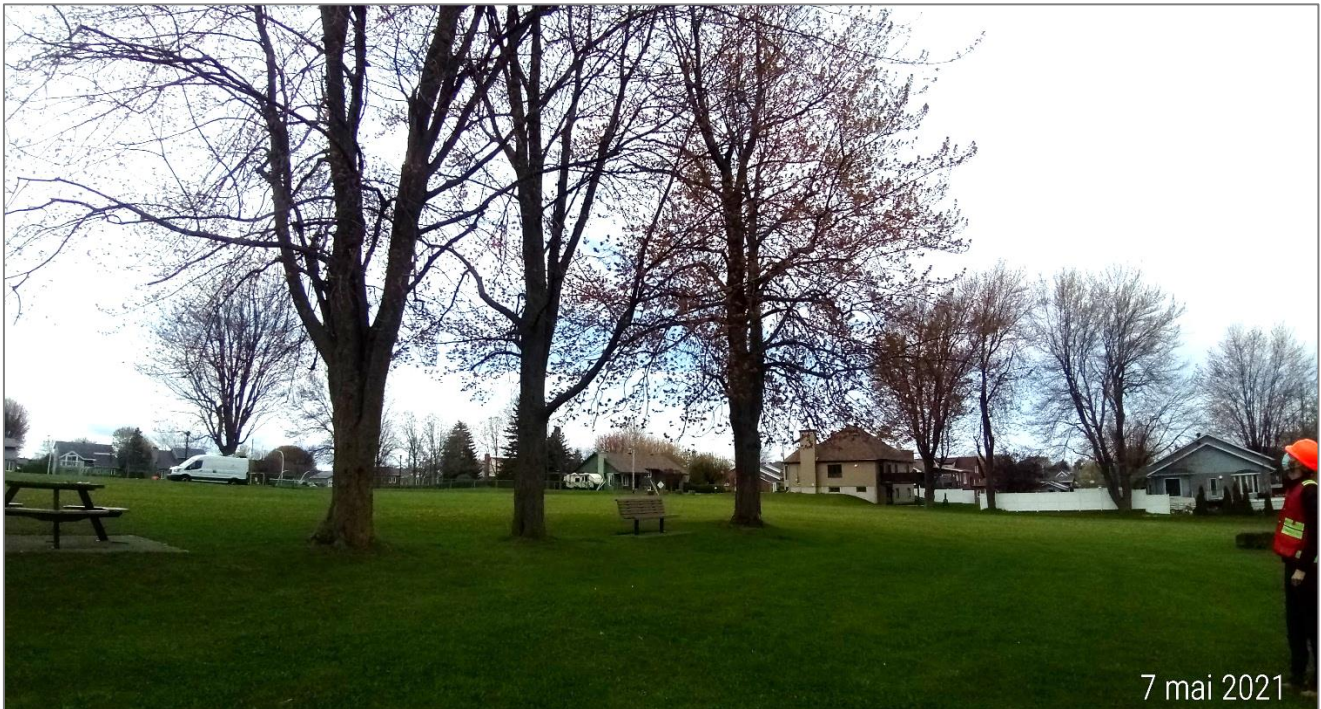
FIGURE 5 APERÇU DE L'INSPECTION VISUELLE DES ARBRES