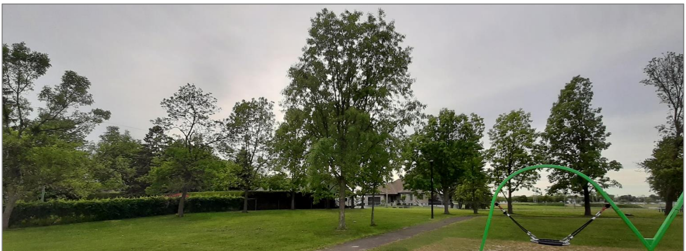
FIGURE 3 EXEMPLE D'UN ARBRE DONT LA CIBLE EST SENSIBLE EN RAISON DE LA PROXIMITÉ DES MODULES DE JEU

À la suite des observations mentionnées ci-dessus, si des travaux apparaissent nécessaires, ils sont notés dans les travaux recommandés. Sans constituer une expertise exhaustive à cet effet, ces recommandations tiennent en compte des risques en fonction de la sensibilité de l'environnement immédiat (nommé cible) et la probabilité