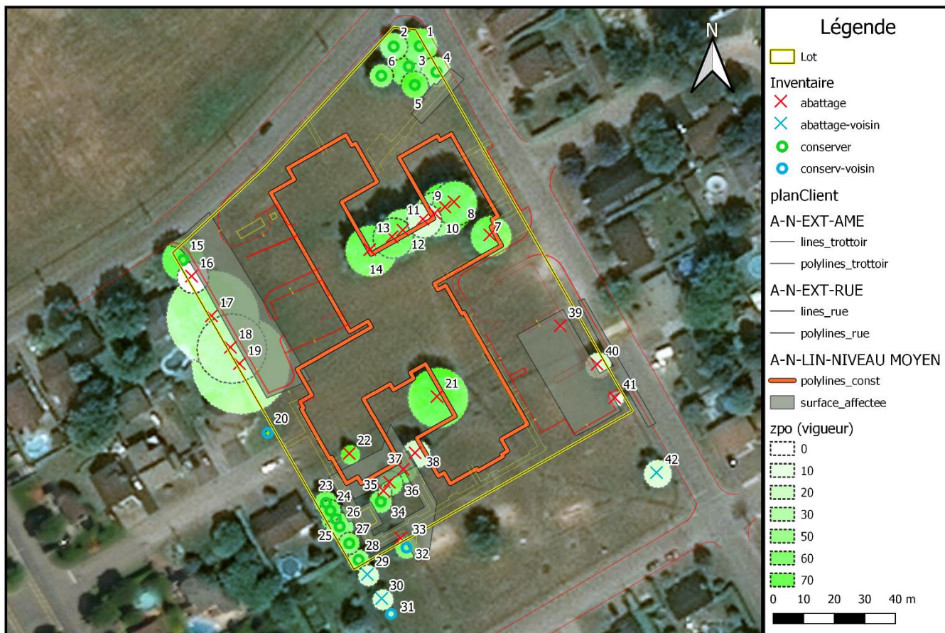
FIGURE 6 PLAN D'IMPLANTATION ET ZPO DES ARBRES À L'ÉTUDE

Ce plan indique les arbres à abattre à l'extérieur du lot. Naturellement, nous ne recommandons pas de procéder à ces travaux sans le consentement de leurs propriétaires. Cette information est une indication de leur état.