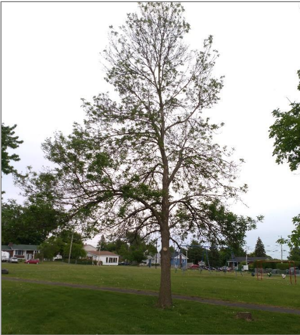
FIGURE 4 FRÊNE DÉPÉRISSANT EN RAISON DE L'INFESTATION D'AGRILE DU FRÊNE

apparente d'un évènement de bris de l'arbre. Notez que ces recommandations de travaux sont formulées au terrain, en fonction de l'état actuel de l'arbre avant l'analyse de l'impact du projet envisagé.